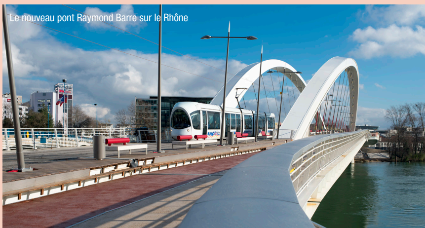
Le nouveau pont Raymond Barre sur le Rhône

Lyon possède le deuxième réseau de transports en commun français derrière Paris , avec 32 km de lignes de métro, 64 km de tramway, 160 km de couloirs de bus et 25 parcs relais. La fréquentation est passée de 304 millions de voyageurs en 2001 à 440 millions dix ans plus tard. Chaque jour, 1,7 million de voyages sont effectués sur le réseau TCL. Et le maillage du territoire progresse : après le prolongement de la ligne de métro B jusqu'à Oullins (Ouest Lyonnais) et celui de la ligne de tramway T1, de nouveaux projets vont être lancés entre 2015-2020.