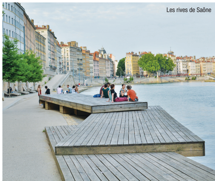
Les rives de Saône