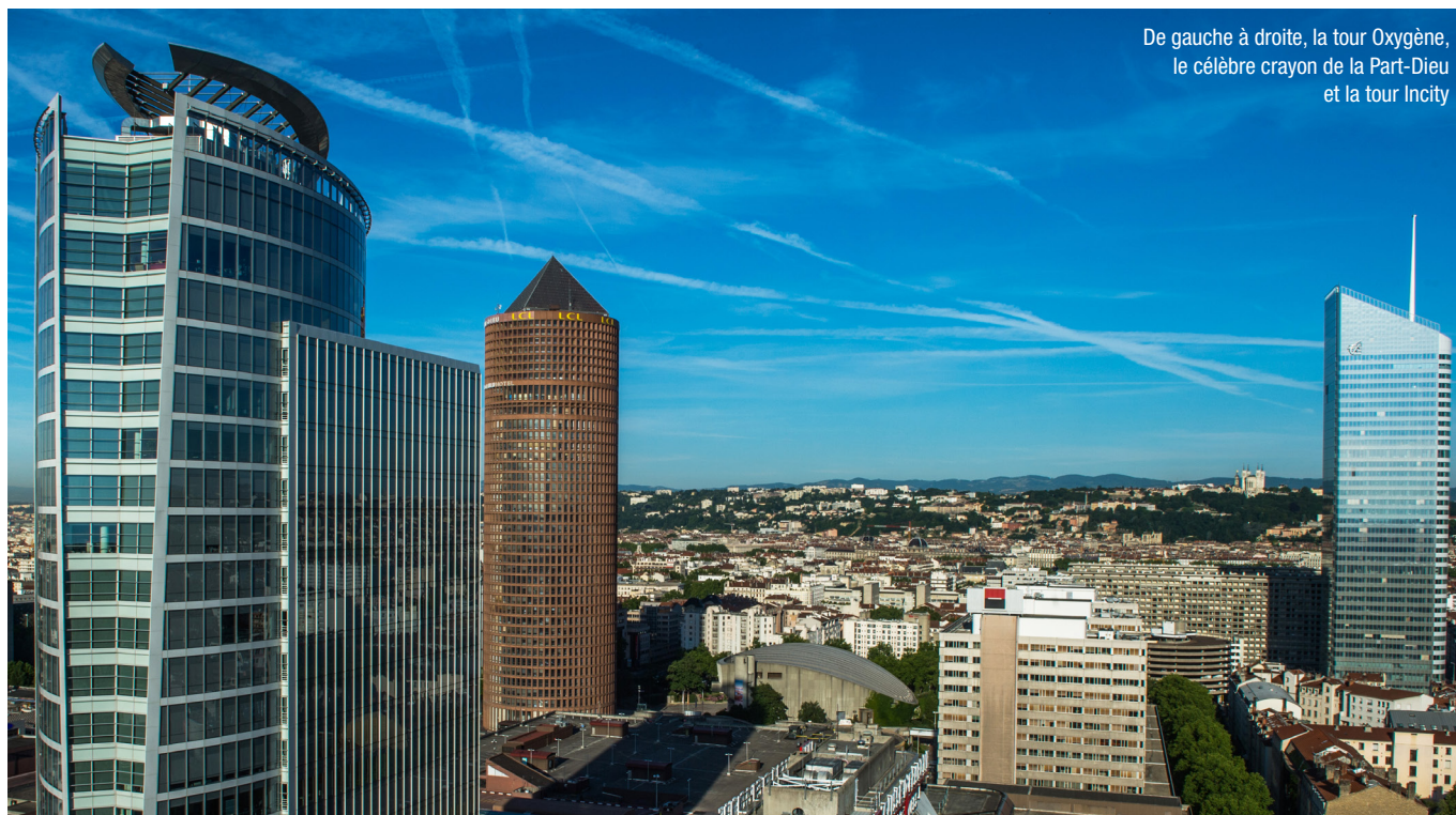
De gauche à droite, la tour Oxygène, le célèbre crayon de la Part-Dieu et la tour Incity