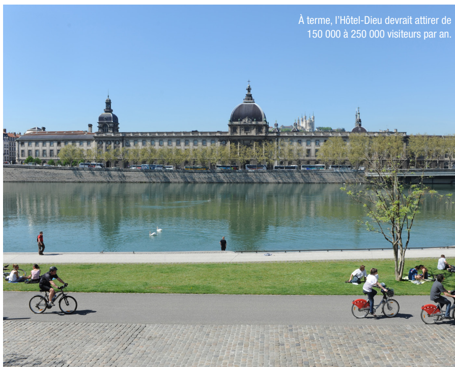
À terme, l'Hôtel-Dieu devrait attirer de 150 000 à 250 000 visiteurs par an.

L'Hôtel-Dieu a pour ambition de devenir une place incontournable de la vie lyonnaise aussi bien pour les habitants que les touristes, avec l'ouverture notamment au public de ses 1 500m 2 de cours intérieurs et jardins, transformés en véritables lieux d'échanges et de détente.