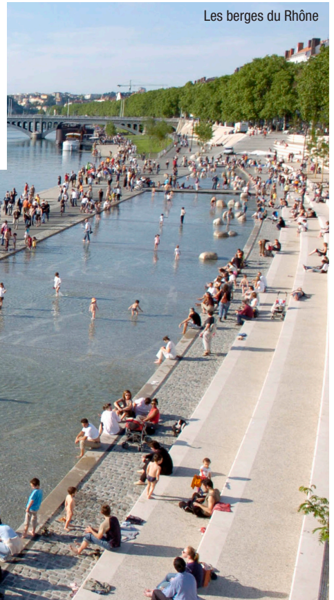
Les berges du Rhône

En quelques années, la Métropole lyonnaise a changé de visage pour devenir plus moderne, plus durable, plus attractive, plus dynamique... Lyon se renouvelle en créant de nouveaux quartiers innovants, mais aussi en requalifiant des quartiers ou monuments historiques qui rendent la ville plus belle, plus verte. Tout simplement plus agréable à vivre.