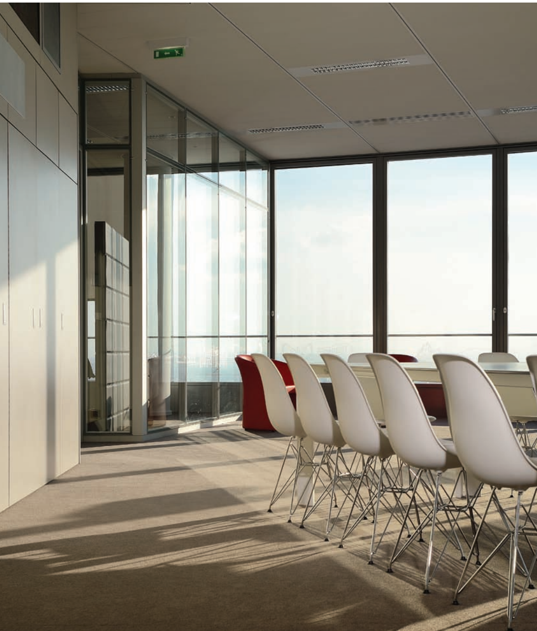
Espace de présentation et de réception