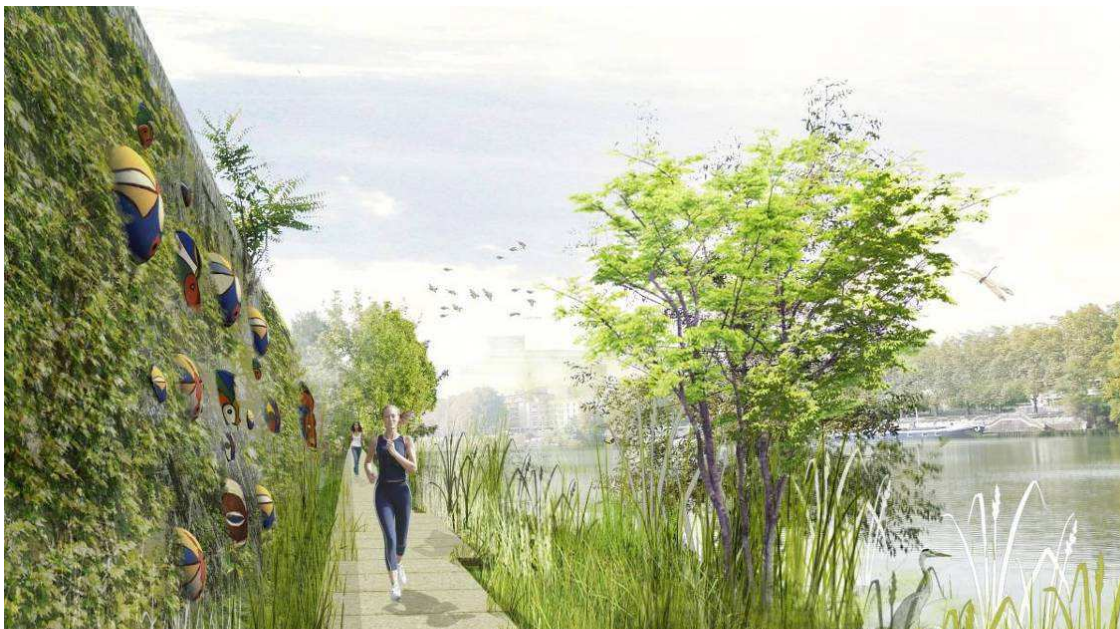
Projet Rives de Saône, œuvres Pascale Marthine-Tayou et Erik Samakh