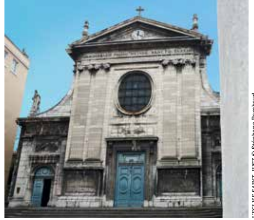
L'EGLISE SAINT-JUST