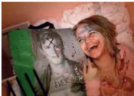
RYAN TRECARTIN, LIZZIE FITCH/RYAN TRECARTIN - The Re Search (re Search Waits)