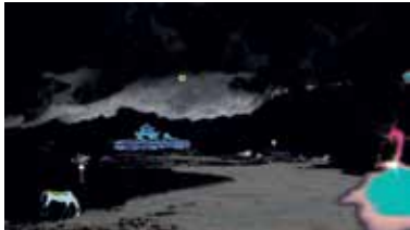
TAKAO MINAMI - Fat Shades