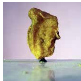
NEIL BELOUFA - Série des nuggerts ★