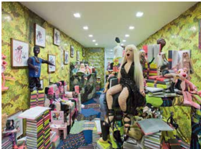
BJARNE MELGAARD - A new novel (Installation view) ★