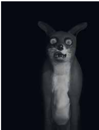
ANN LISLEGAARD - Time Machine: Details ★