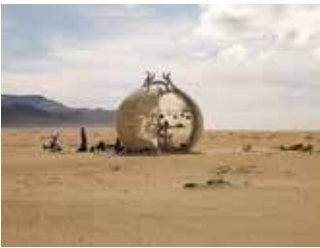
GABRIELA FRIDRIKSDOTTIR - Crepusculum video 2011