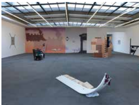
HELEN MARTEN - Take a stick and make it sharp