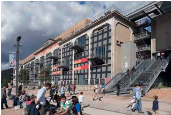
LA SUCRÈRE - BERNARDO ORTIZ. Vue extérieure