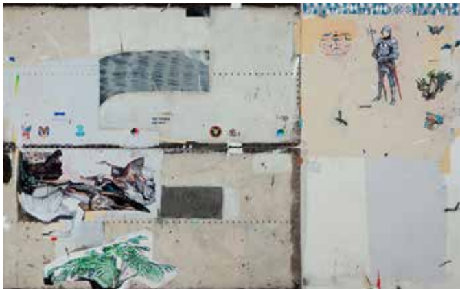
PAULO NIMER PUJOTA - Diálogo entre Arranjos. Constelações e Tempo I