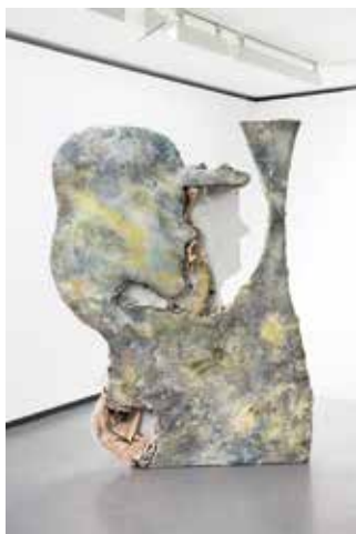
DAVID DOUARD - Under influence 2 © kleinefem ★