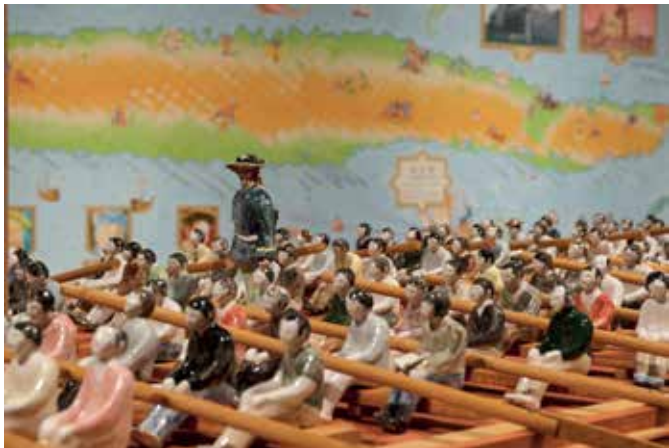
NOBUAKI TAKEKAWA - Island of Nucleides (back) ; Galley in the Age of Great Knowledge (front)