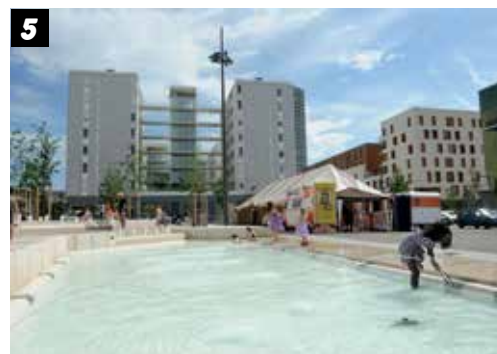
© Laurence Danière / Mission Lyon La Duchère - juin 2012