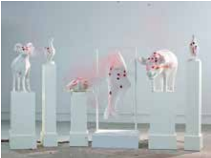
ZHANG DING - Buddha jumps over the wall