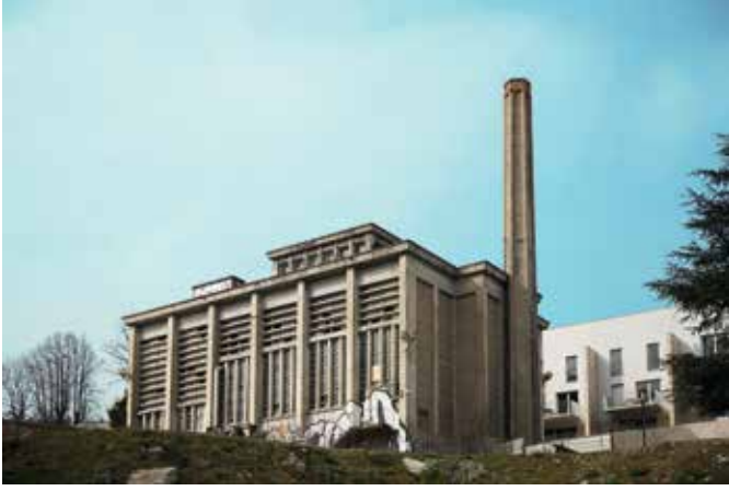
LA CHAUFFERIE DE LANTOUAILLE