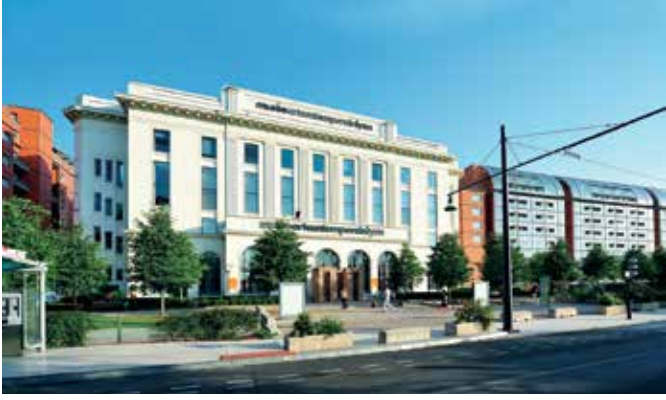
LE MUSÉE D'ART CONTEMPORAIN