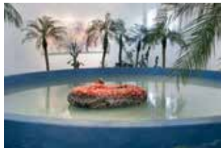
MADEIN COMPANY - Seeing One's Own Eyes ★