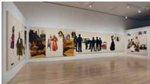
MELEKO MOKGOSI - Pax Kaffraria: Sikhuselo Sembumbulu ★