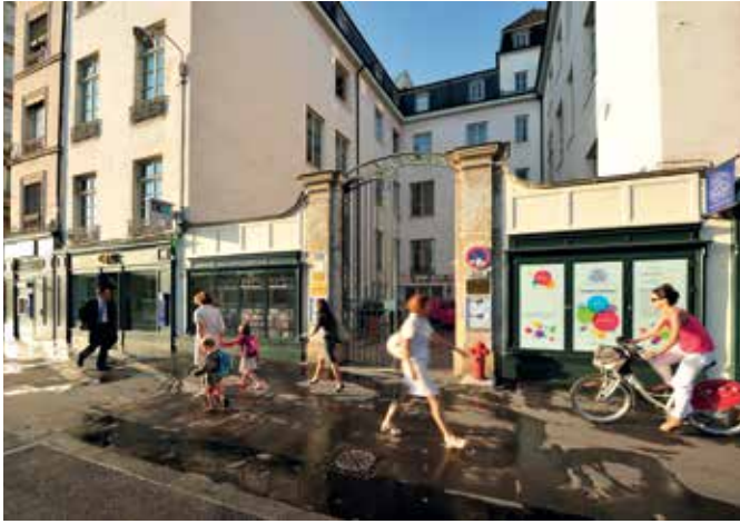
LA FONDATION BULLUKIAN