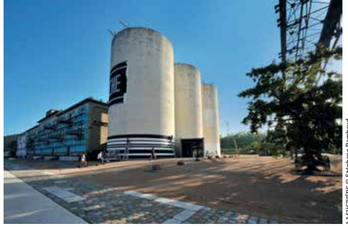
LA SUCRIÈRE