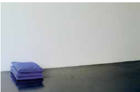
JASON DODGE - Pillows that have only been slept on by doctors... the doctors are sleeping