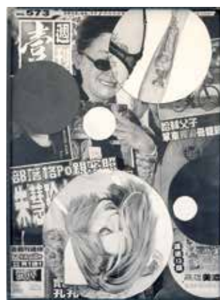
KARL HAENDEL - Inked #7 ★