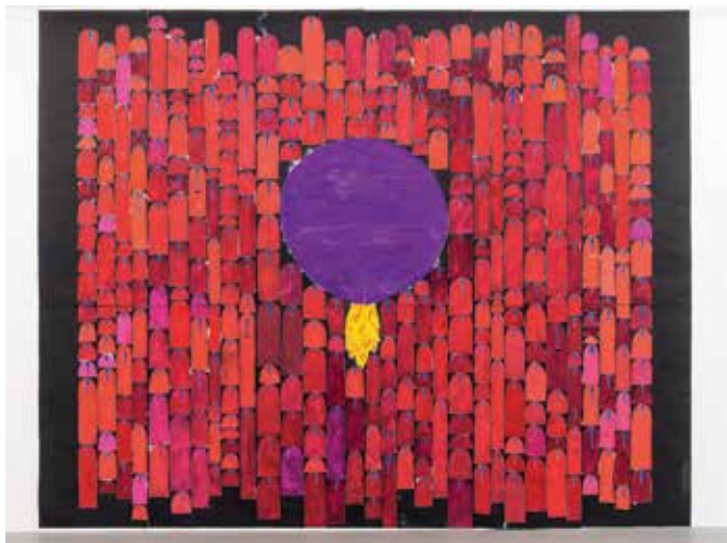
MATTHEW RONAY - Release Absorb Return ★