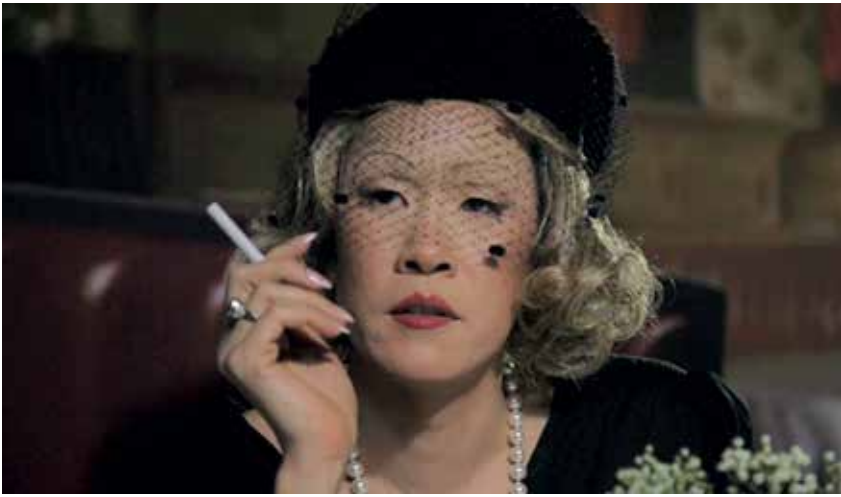
MING WONG - Making Chinatown © DR ★