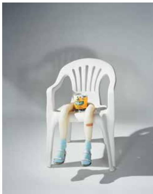
ROBERT GOBER - Untitled © Andrew Rogers ★