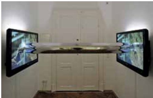
ANTOINE CATALA - TV: Tube ★