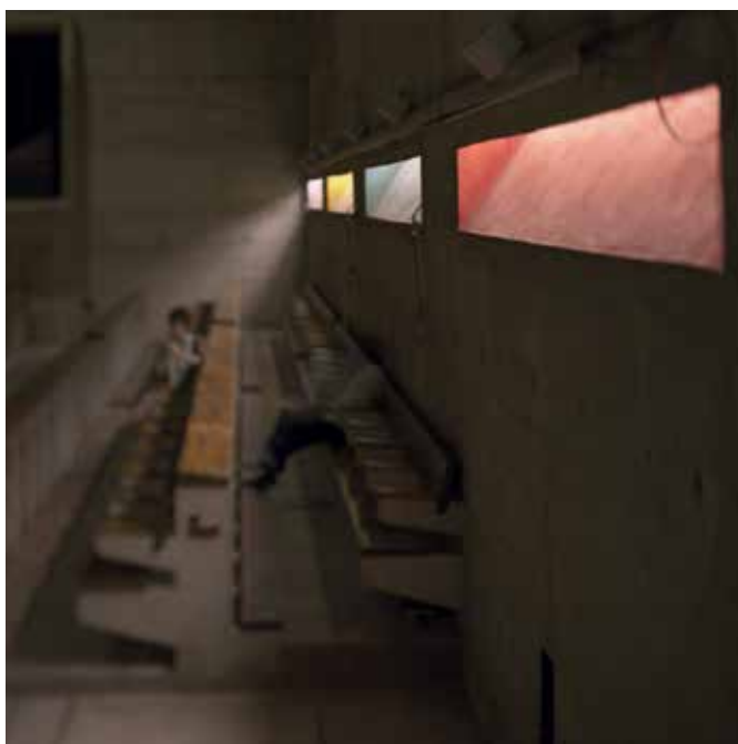
COUVENT DE LA TOURETTE