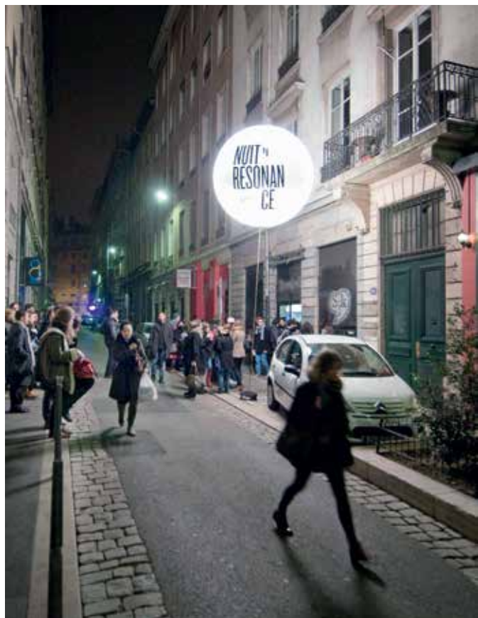
NUIT DE LA RÉSONANCE 2011 - Vue extérieure, rue des Capucins, Lyon 1 er