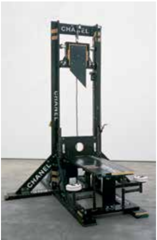
TOM SACHS - Chanel Guillotine (breakfast noo) ★