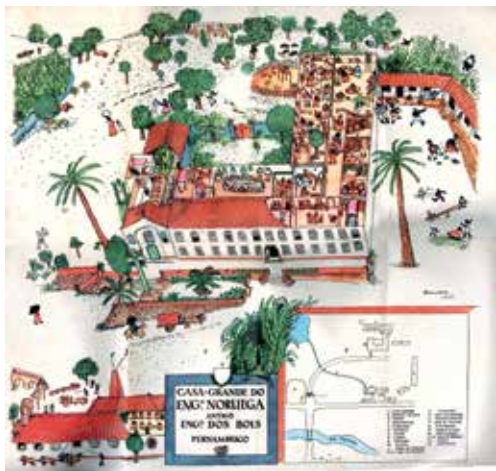
JONATHAS DE ANDRADE SOUZA - 40 black's candies is R$ 1,00