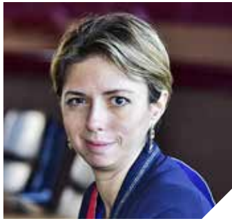
GROUPE D'UNION DE L'OPPOSITION LES RÉPUBLICAINS-UDI-DVD