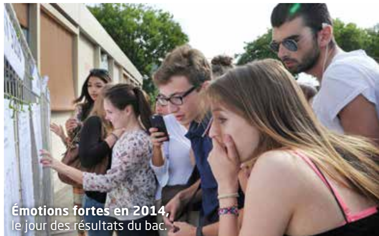
Émotions fortes en 2014, le jour des résultats du bac.

(2) Économie sociale et familiale (ESF) et Négociation et relation client (NRC).