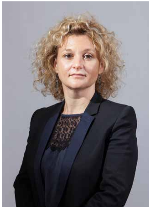
Mehrak pour Soreqa

● PROPOS RECUEILLIS PAR CHRISTELLE GARANCHER