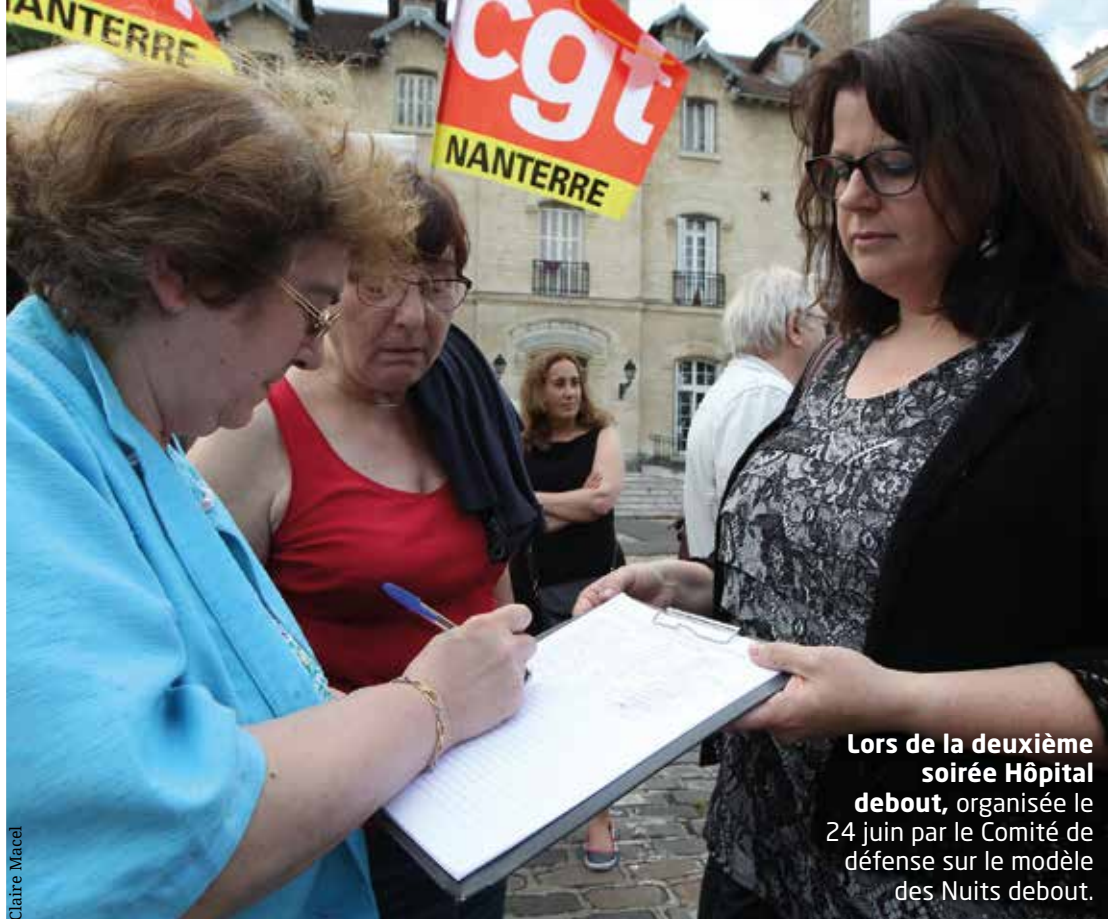
Lors de la deuxième soirée Hôpital debout, organisée le 24 juin par le Comité de défense sur le modèle des Nuits debout.