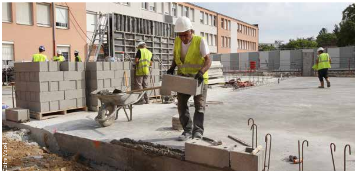
Lancée en avril dernier, la rénovation du groupe scolaire des Pâquerettes au Petit-Nanterre devrait être achevée pour la rentrée 2018.

Mais à Nanterre, on ne fait pas qu'entretenir le patrimoine existant. On rénove XXL. Dernière opération en date au groupe scolaire des Pâquerettes. Commencé en avril, le projet prévoit la démolition-reconstruction de l'école maternelle, l'extension et la réhabilitation de l'école élémentaire et la rénovation du centre de loisirs. Pour ce chantier, qui s'inscrit dans le cadre du Projet de rénovation urbaine et sociale