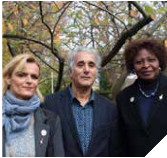
GROUPE MODEM ET CITOYENS