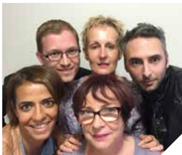
GROUPE ÉCOLOGISTES ET CITOYENS