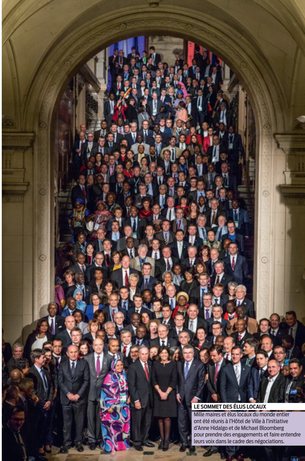
LE SOMMET DES ÉLUS LOCAUX