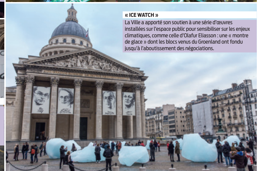
« ICE WATCH »

Un projet artistique monumental signé Naziha Mestaoui a éclairé la tour Eiffel aux couleurs de la COP21. Une application numérique permettait de créer virtuellement un arbre de lumière qui sera réellement planté dans le cadre d'un projet de reforestation conduit par une association.