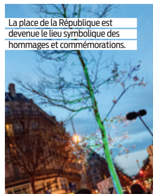
La place de la République est devenue le lieu symbolique des hommages et commémorations.