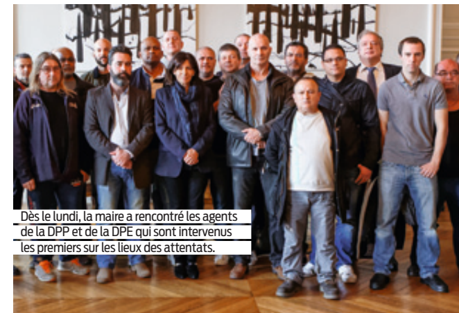
Dès le lundi, la maire a rencontré les agents de la DPP et de la DPE qui sont intervenus les premiers sur les lieux des attentats.

treize cimetières intra-muros et six extra-muros de la Ville est réalisé afin de s'assurer de pouvoir répondre à toutes les demandes d'inhumation et de crémation. Via le 3975, des agents du service funéraire de la Ville de Paris ainsi que des psychologues informent et orientent dans leurs démarches les proches des victimes, tandis que les procédures sont accélérées. Un numéro vert est mis à leur disposition pour les accompagner dans l'organisation des obsèques et centraliser les demandes d'acquisitions de concession. Le service des cimetières s'organise de façon à répondre aux demandes dans un délai d'un jour ouvré. Les premiers permis d'inhumer sont, quant à eux, délivrés dès le mardi suivant les attentats. Un traitement accéléré des démarches d'état civil est mis en place dans toutes les mairies d'arrondissement pour les victimes et leurs familles. Un guichet unique d'accueil des personnes et des familles touchées est ouvert. Il est coordonné par le CASVP et une cellule pluridisciplinaire est mise en place pour répondre dans un second temps aux besoins identifiés des victimes. ●