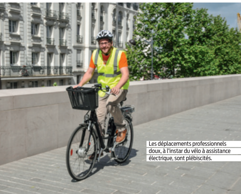
Les déplacements professionnels doux, à l'instar du vélo à assistance électrique, sont plébiscités.