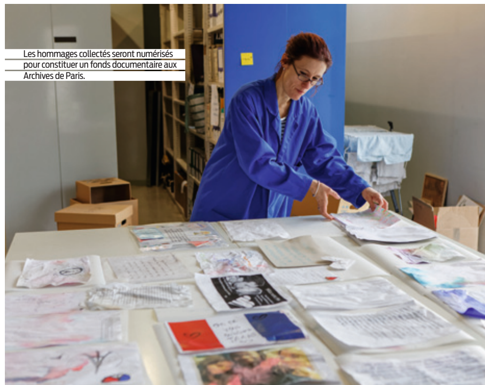
Les hommages collectés seront numérisés pour constituer un fonds documentaire aux Archives de Paris.

rité, même constat chez les agents d'accueil et de surveillance. Les professionnels travaillant dans les crèches et les écoles ont aussi eu besoin d'aide car ils n'étaient pas préparés à recueillir la parole et le questionnement des parents et des enfants. Les images en boucle sur les télévisions ont quant à elles énormément choqué les personnes, au même titre que celles du 11 Septembre aux États-Unis. Au-delà des interventions individuelles, nous sommes également intervenus à titre collectif, notamment à la mairie du 11 e , dans les crèches, etc. Ces journées ont été très éprouvantes et ont brassé beaucoup d'émotions. Même si je suis préparée à cela, il n'est pas possible pour autant de rester indifférente parce qu'au-delà d'être une professionnelle, je suis aussi une citoyenne, impactée, comme chacun a pu l'être, par la violence des événements. Ce que les victimes ou témoins ont pu vivre leur laissera des cicatrices plus ou moins sensibles. Et rencontrer un psychologue pour certains, au-delà de les apaiser face à l'horreur de leur vécu, leur a permis d'interroger la société mais surtout de se questionner eux-mêmes sur le sens à donner à leur vie aujourd'hui et sur ce qu'ils décident de faire de ce qui leur est arrivé. » ●