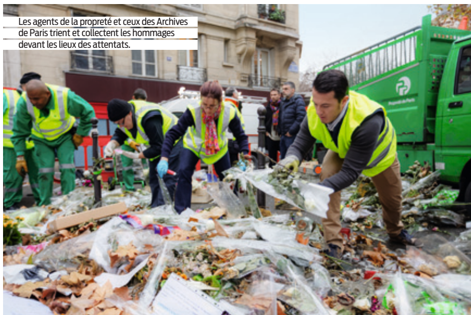
Les agents de la propreté et ceux des Archives de Paris trient et collectent les hommages devant les lieux des attentats.