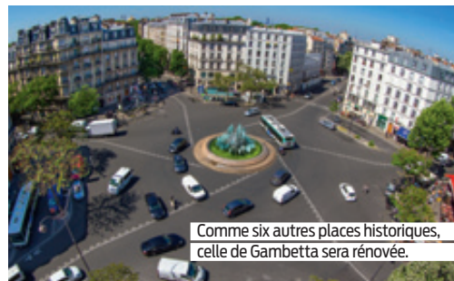
Comme six autres places historiques, celle de Gambetta sera rénovée.

lette...). Pour s'adapter aux dérèglements climatiques, la piétonisation des berges de Seine rive droite sur 3,3 km, entre le pont des Tuileries et le pont Henri-IV, sera mise en place après Paris Plages. De nouveaux tronçons de la Petite Ceinture dans le 13 e ainsi que quatre nouvelles rues végétalisées (8 e , 9 e , 10 e et 20 e ) seront prochainement inaugurées. Dès le printemps, 50 % des parcs resteront ouverts tous les jours, 24 h/24 de mi-avril à mi-septembre. Toujours au printemps, trois hectares et demi d'espaces verts du domaine de Longchamp ouvriront au public et les Champs-Élysées seront réservés un dimanche par mois aux piétons. Le périmètre de la Journée sans voiture (dernier week-end de septembre) sera, quant à lui, élargi à tout Paris. ●