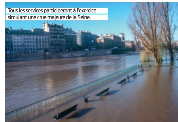
Tous les services participeront à l'exercice simulant une crue majeure de la Seine.