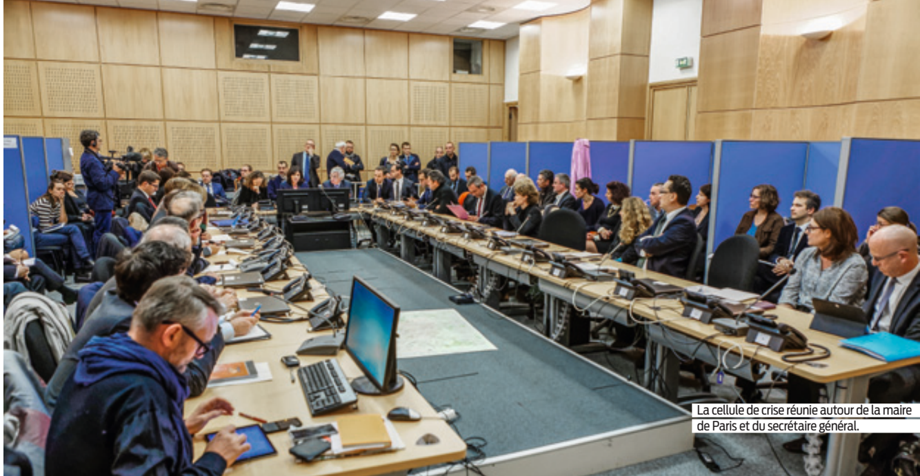
La cellule de crise réunie autour de la maire de Paris et du secrétaire général.