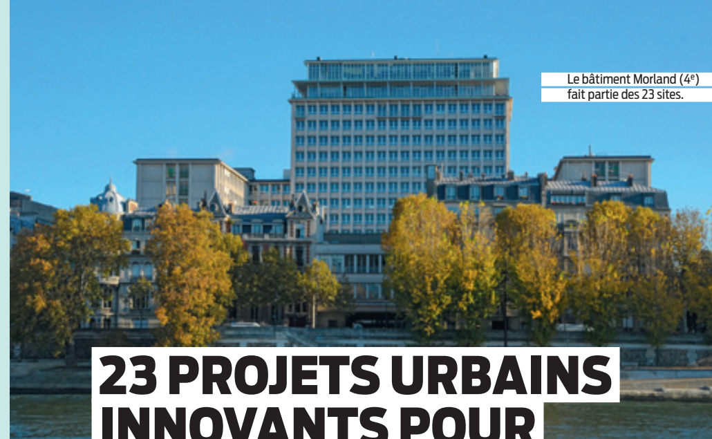
Le bâtiment Morland (4 e ) fait partie des 23 sites.

> 14 février. Village de la course Crystal Run. Lieu principal des animations, du départ et de l'arrivée de la course. > Du 15 au 20 mars. Les 150 ans de la Fondation Apprentis d'Auteuil qui accueille, forme et soutient des milliers d'enfants, adolescents et adultes en situation difficile en France et dans le monde. > Du 30 mars au 3 avril. Paris Foot Tour, le village itinérant d'activités sportives et de promotion de l'UEFA EURO 2016. > Du 15 au 17 avril. Village de la course Color Run. Départ de la course et animations. > 28 et 29 avril. Le basket envahit Paris. Un village dédié au basket avec de nombreuses animations, initiations, jeux et tournois.