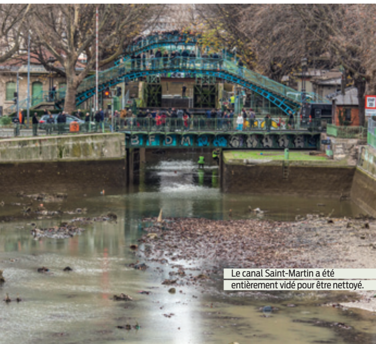
Le canal Saint-Martin a été entièrement vidé pour être nettoyé.

Entièrement vidé de ses 90 000 m 3 d'eau pour trois mois, le canal Saint-Martin fait l'objet d'un nettoyage et de travaux menés par le service des Canaux, dont l'objectif principal est de rénover les écluses. Il doit être remis en eau le 4 avril, date à laquelle il accueillera à nouveau la navigation fluviale dans de meilleures conditions. Une telle opération n'avait pas été réalisée depuis 2001. Les éclusiers ont donc ouvert les vannes le 4 décembre pour permettre à l'eau de s'écouler naturellement vers la Seine. À noter que quatre à cinq tonnes de poissons ont été démnagés pendant l'opération. L'ensemble des déchets collectés sera évacué dans des péniches par voie fluviale vers des sites de traitement permettant un tri, une revalorisation et un recyclage de nombreux objets, y compris de la vase. ●