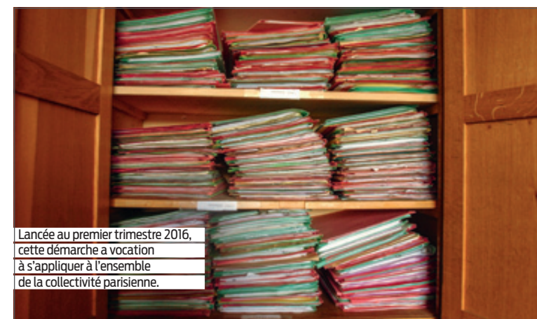
Lancée au premier trimestre 2016, cette démarche a vocation à s'appliquer à l'ensemble de la collectivité parisienne.