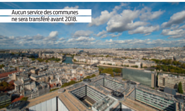
Aucun service des communes ne sera transféré avant 2018.