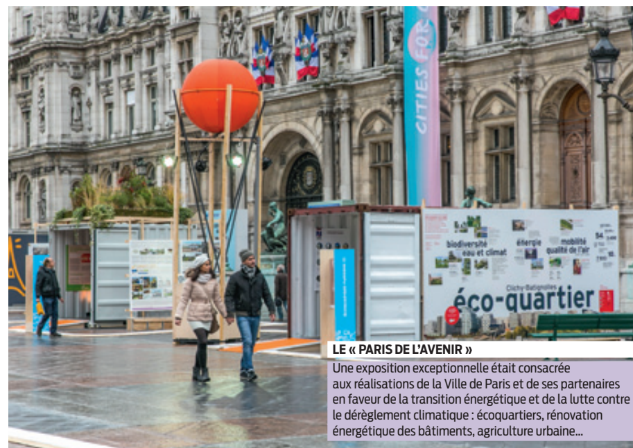
LE « PARIS DE L'AVENIR »