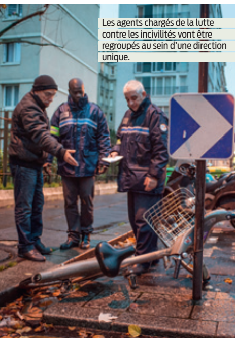
Les agents chargés de la lutte contre les incivilités vont être regroupés au sein d'une direction unique.