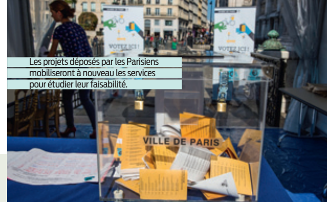
Les projets déposés par les Parisiens mobiliseront à nouveau les services pour étudier leur faisabilité.

UN CHÊNE DE PLUS DE 10 MÈTRES a été érigé sur la place de la République à la mémoire des victimes des attentats de janvier et de novembre 2015. Une vingtaine d'élèves des cours municipaux pour adultes à l'École du Breuil ont planté 1200 vivaces au pied de l'arbre. Des plaques commémoratives rappelant les noms des victimes ont été apposées sur les différents lieux.