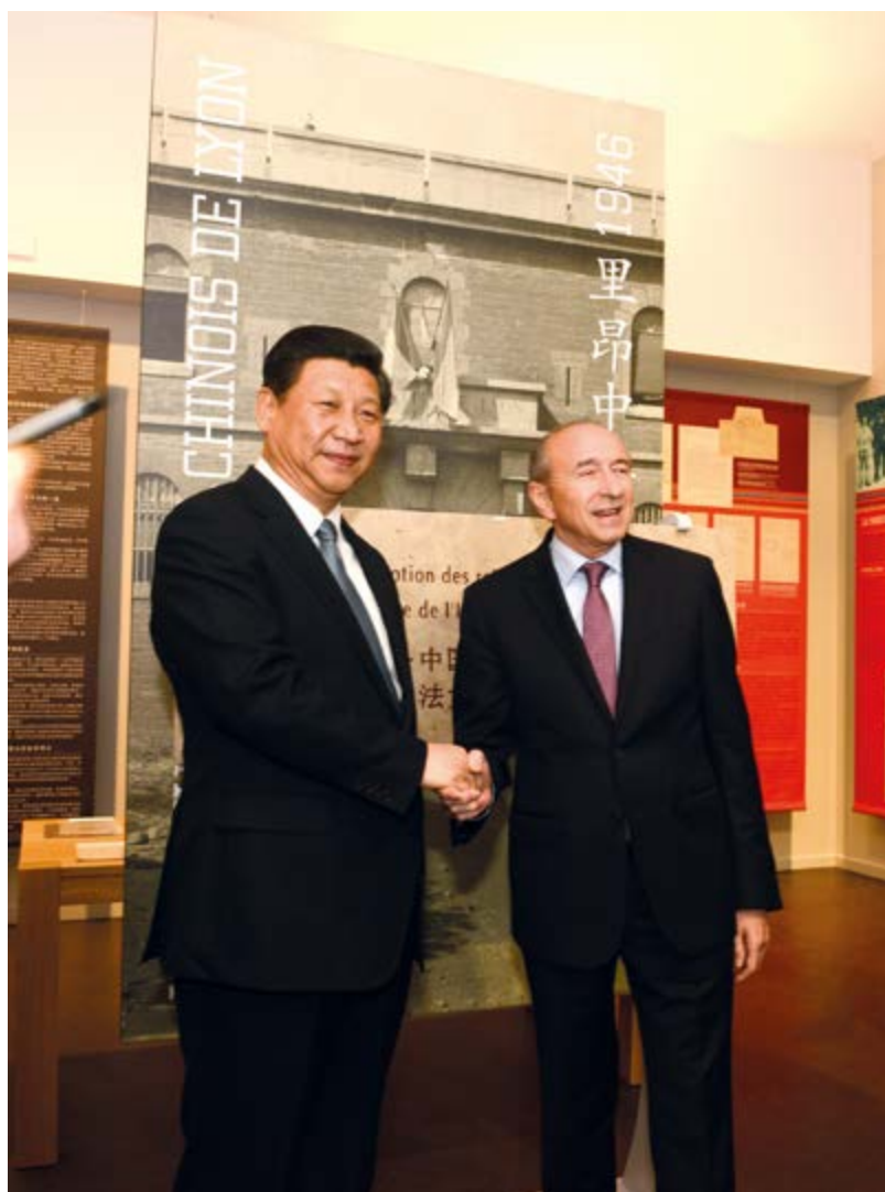
Visite du Nouvel Institut Franco Chinois par le Président de la République Populaire de Chine Monsieur Xi Jinping et le Sénateur Maire de Lyon Monsieur Gérard Collomb

Sur le plan culturel , après la fermeture de l'institut, la Bibliothèque municipale de la Ville de Lyon s'est vu confier par l'Université de Lyon les collections de l'ancien Institut franco-chinois de Lyon qui a initié la constitution d'un précieux et important Fonds chinois. Aujourd'hui, le Fonds Chinois de la Bibliothèque municipale de Lyon compte plus de 60 000 documents dont la majorité en langue chinoise, comprenant notamment 25 000 ouvrages et plus de 500 périodiques. Ce Fonds continue de s'enrichir constamment grâce à une politique d'acquisition mais aussi par les dons de sinologues de renom tels que le général Jacques Guillerma, militaire et diplomate (1911-1998) ou Michelle Loi, sinologue, spécialiste de la littérature chinoise moderne, (1926-2002).