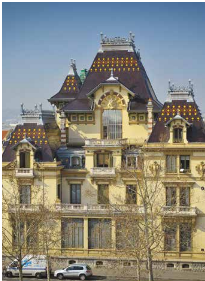
Le théâtre des Célestins