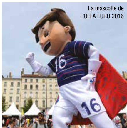
La mascotte de L'UEFA EURO 2016