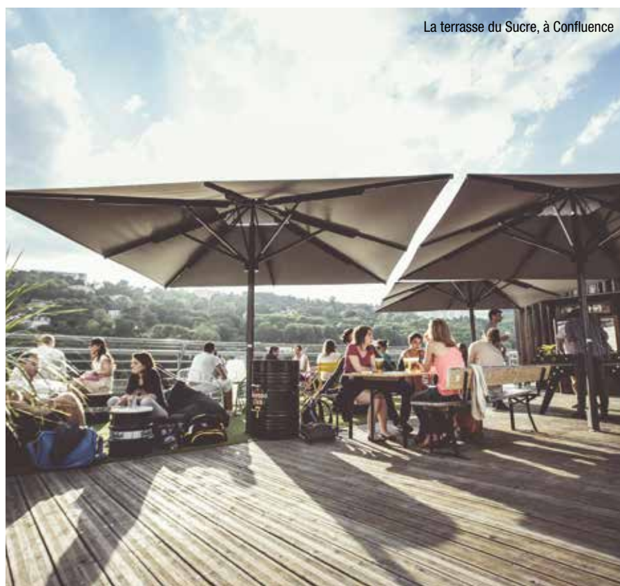
La terrasse du Sucre, à Confluence

Cette course carnavalesque d'OPEN (Œuvres Pouvant Évoluer en Naviguant) a lieu sur le Rhône, entre la Cité Internationale et les Terrasses de la Guillotière. Les spectateurs peuvent apprécier la descente depuis les berges, d'où ils voient des embarcations diverses et variées aux couleurs des nations disputant la compétition de l'EURO 2016.