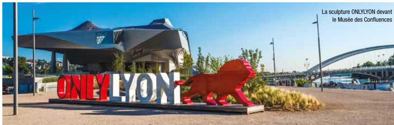
La sculpture ONLYLYON devant le Musée des Confluences