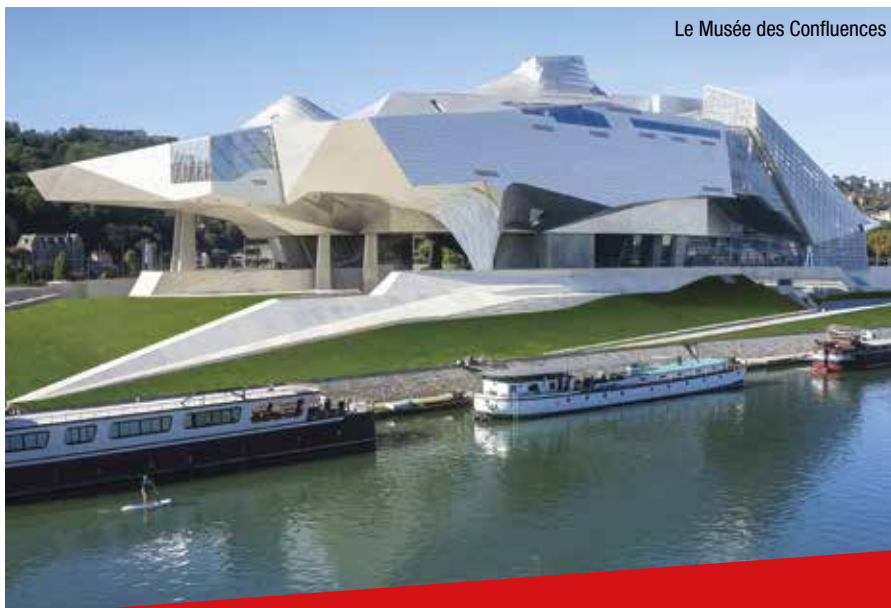
Le Musée des Confluences

C'est en parfaite harmonie que cette énergie culturelle est entretenue par des événements tels que la Biennale de la Danse, 1 er festival de danse en Europe, la Biennale d'art contemporain, unique en France, le Festival Lumière, un événement à la fois populaire et créatif, ou encore les Nuits Sonores, laboratoire mondial de musiques électro... des moments culturels d'envergure internationale attirant chaque année des milliers de personnes.