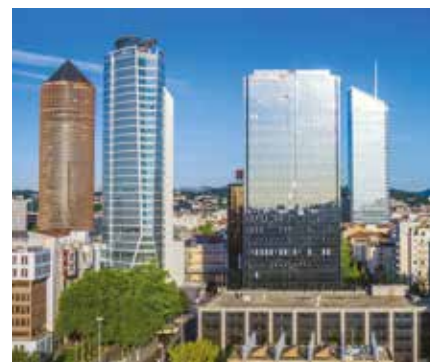
Le quartier de Lyon Part-Dieu

Le développement tertiaire fait également partie des priorités de la ville, manifesté par ses grands projets urbains : Lyon Part-Dieu en est l'évidence même. En effet, ce quartier d'affaires d'envergure européenne est le 2 ème hub tertiaire de France après Paris-La Défense et représente ainsi une adresse prestigieuse pour les entreprises.