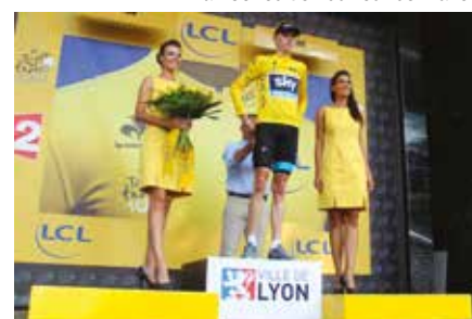
La 100 e édition du Tour de France

Par ailleurs, l'organisation de grands événements sportifs reconnus mondialement et disposant d'une large couverture médiatique fait partie de la stratégie de développement de la notoriété de l'agglomération lyonnaise. Lyon accueillera ainsi la Coupe du Monde FIFA féminine en 2019 et s'est portée candidate à l'organisation des Finales Européennes de Football, après avoir obtenu celles de Rugby en 2016.