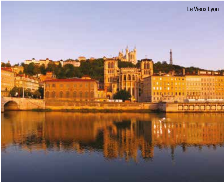
Le Vieux Lyon

Avec de nombreux atouts, tant patrimoniaux qu'économiques et culturels, Lyon se place comme une capitale internationale.