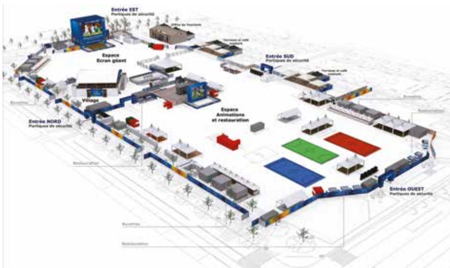
La fan zone sur la place Bellecour