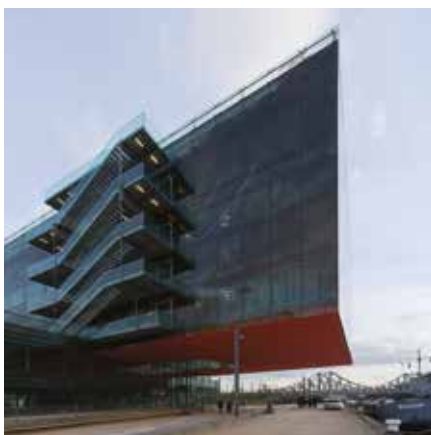
Le siège de GL Events