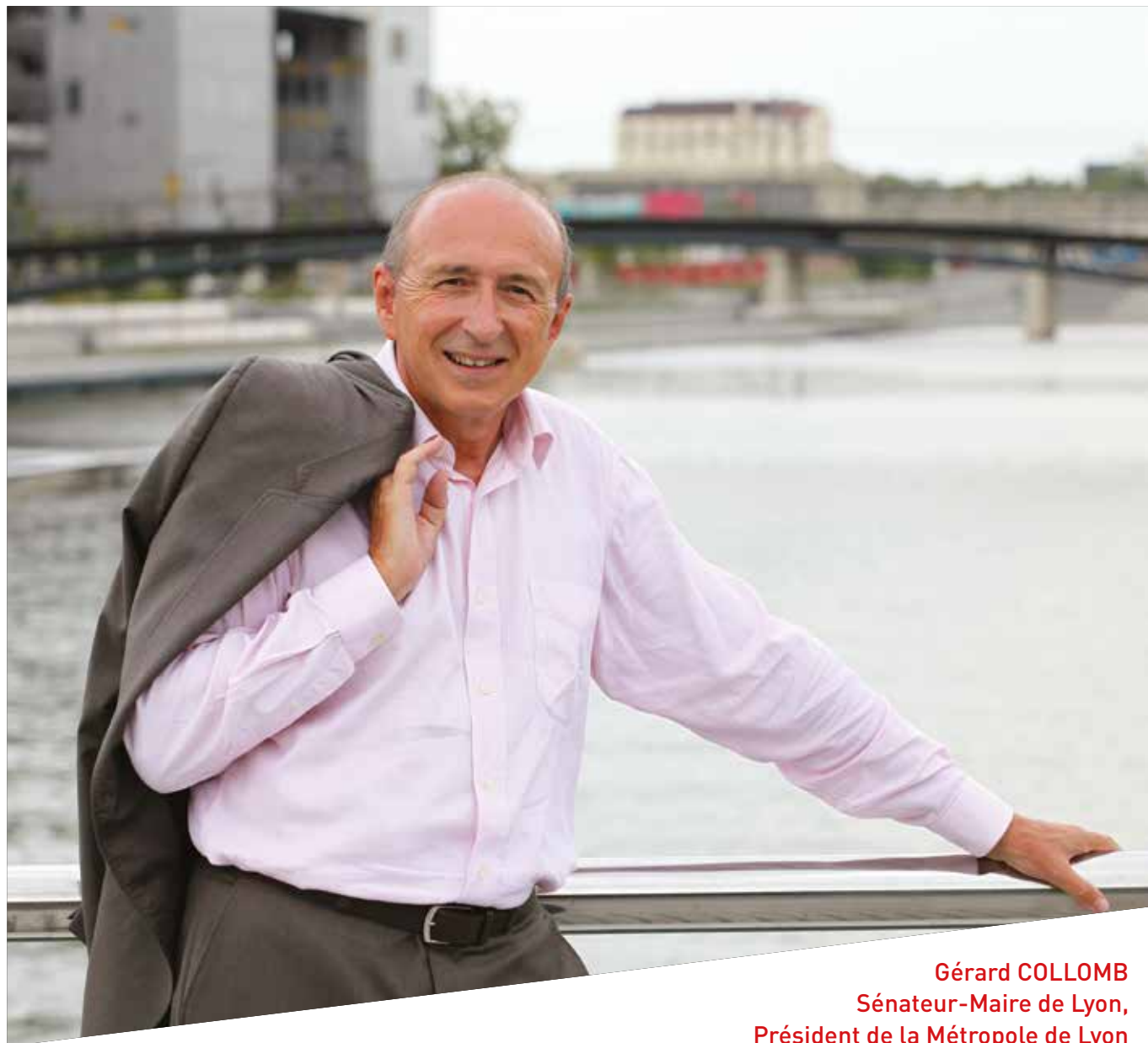
Gérard COLLOMB Sénateur-Maire de Lyon, Président de la Métropole de Lyon

« Avec la Fête des Lumières, les Biennales d'art contemporain ou de la danse, le Festival de cinéma Lumière et bien d'autres rendez-vous culturels, avec l'organisation des plus grandes épreuves sportives mondiales, du Tour de France à la Coupe Davis, de la Coupe du Monde de Rugby aux finales mondiales d'équitation, Lyon s'affirme comme une Métropole tournée vers le monde.