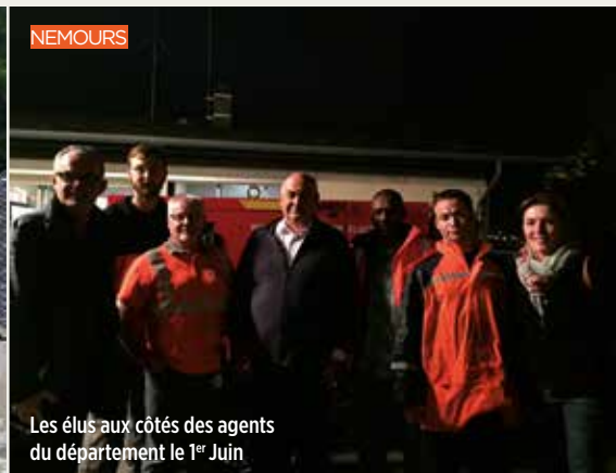
Les élus aux côtés des agents du département le 1 er Juin