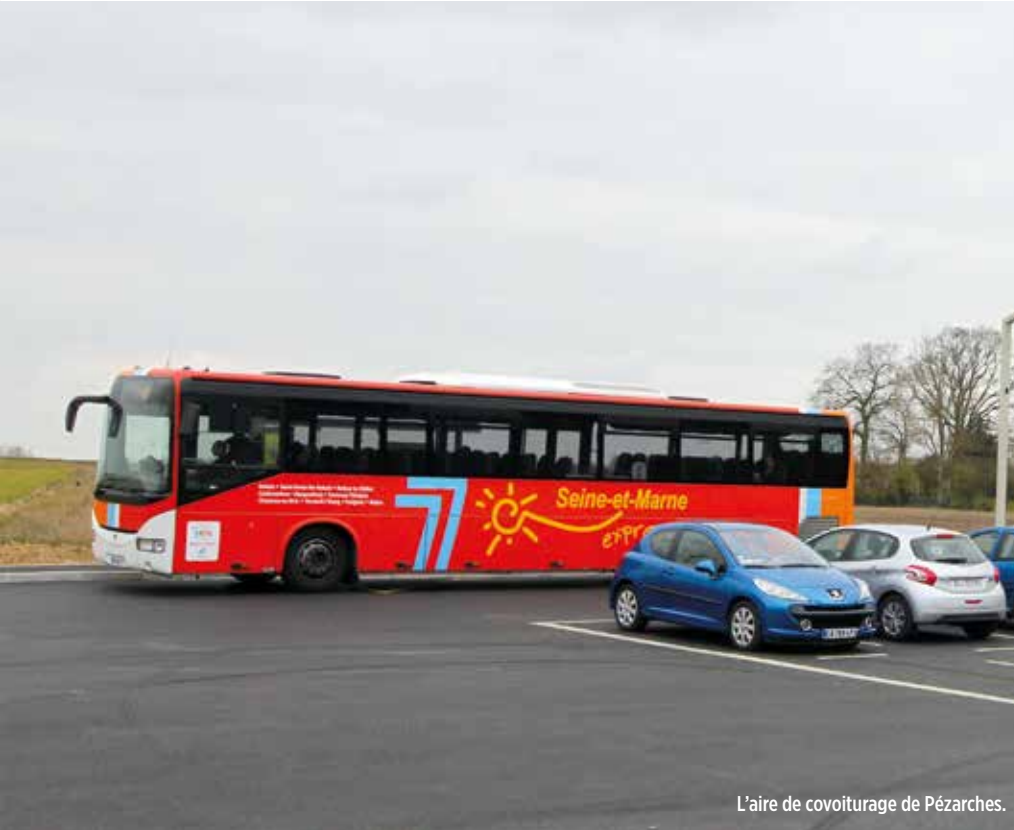
L'aire de covoiturage de Pézarches.