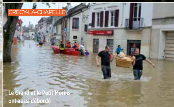
Le Grand et le Petit Morins ont aussi débordé