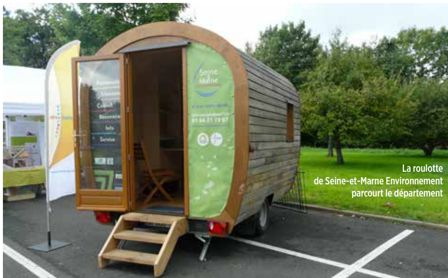
La routlotte de Seine-et-Marne Environnement parcourt le département