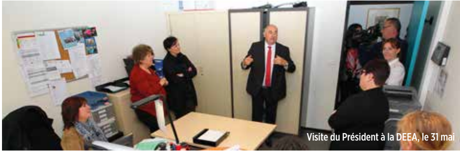
Visite du Président à la DEEA, le 31 mai

Le 31 mai, je passai la matinée avec vos collègues de la Direction de l'eau, de l'environnement et de l'agriculture (DEEA). Un rendez-vous pris de longue date pour en apprendre davantage sur leurs métiers, en particulier celui qui consiste à surveiller la quantité et la qualité de l'eau, richesse si précieuse dans notre département. C'est alors que nous avons appris l'imminence d'une crue du Loing sous l'effet de pluies incessantes depuis plusieurs jours.