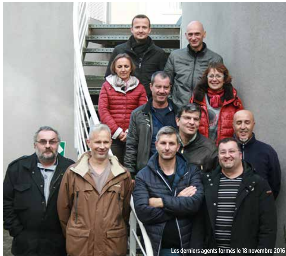
Les derniers agents formés le 18 novembre 2016