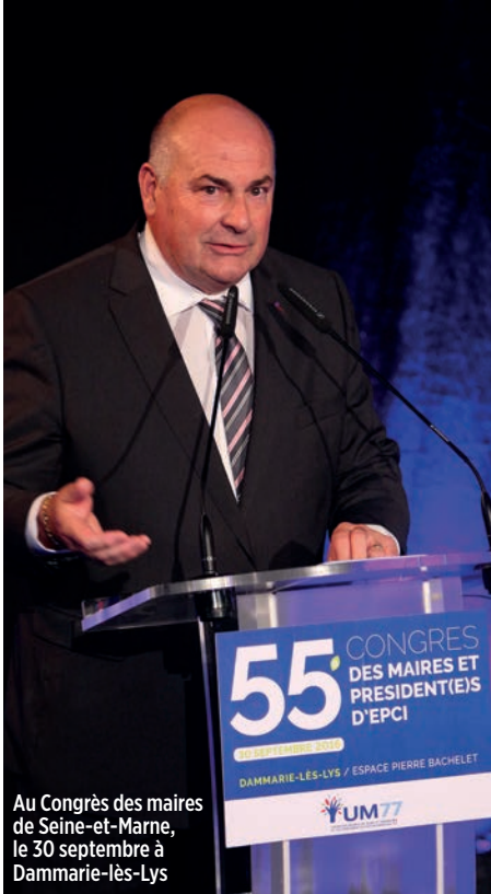
Au Congrès des maires de Seine-et-Marne, le 30 septembre à Dammarie-lès-Lys