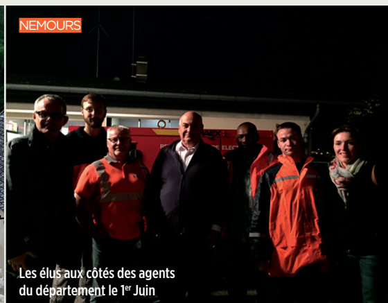
Les élus aux côtés des agents du département le 1 er Juin