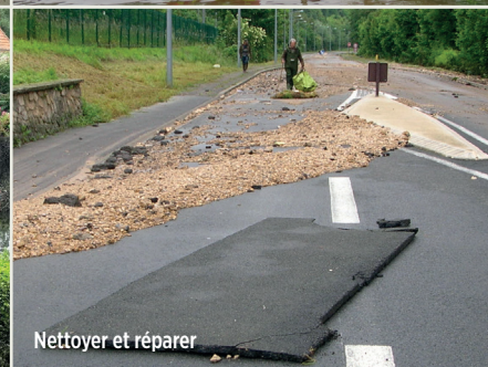
Nettoyer et réparer