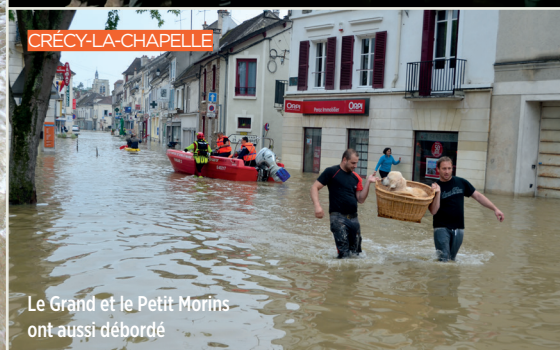
Le Grand et le Petit Morins ont aussi débordé