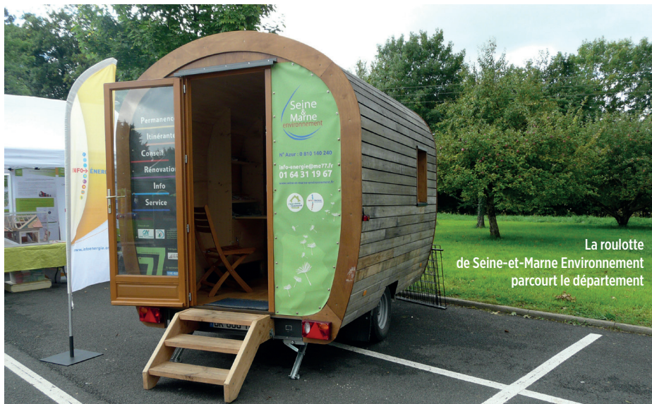
La roulotte de Seine-et-Marne Environnement parcourt le département