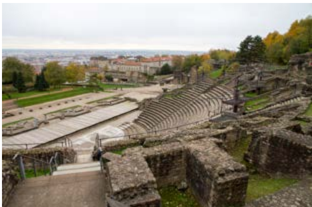
Théâtre Gallo Romain de Fourvière

A la croisée du Rhône et de la Saône, Lyon offre un témoignage exceptionnel de continuité d'un site urbain sur plus de deux millénaires.